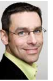
Arndt Klocke, Landesvorsitzender

Demokratie funktioniert nur, wenn alle Bürgerinnen und Bürger das Recht haben, sich an der politischen Diskussion aktiv zu beteiligen. Die schwarz-gelbe Landesregierung hat dies systematisch beschnitten – zum Beispiel durch die Abschaffung der Stichwahl bei den Bürgermeisterwahlen. Wir Grünen wollen diese Entwicklung rückgängig machen. Die Einführung des Wahlrechts bei Kommunalwahlen für Migrantinnen und Migranten aus Nicht-EU-Ländern ist für uns ebenso selbstverständlich wie die Absenkung des Wahlalters bei Kommunal- und Landtagswahlen auf 16 Jahre. Kumulieren und Panaschieren werden wir ebenfalls für Kommunalwahlen einführen. Wir wollen außerdem mehr Volksabstimmungen und -entscheidungen ermöglichen, gerade bei Verfassungsänderungen.