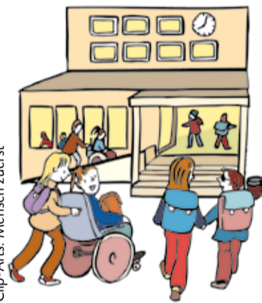
Clip-Art: Mensch zuerst

Wenn du in die Schule gehst und Schreiben lernst, nennt man das Bildung. Wir finden, dass die CDU